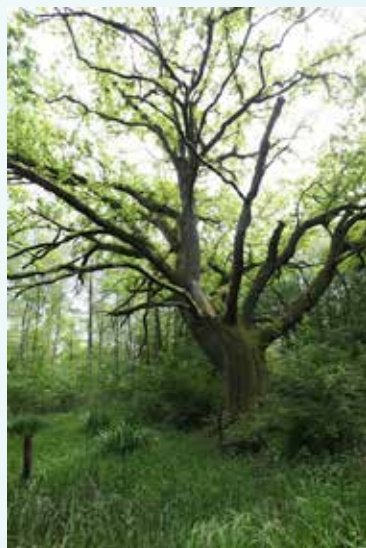
Domaine du Vieux Moulin et réserve naturelle régionale de Lachaussée